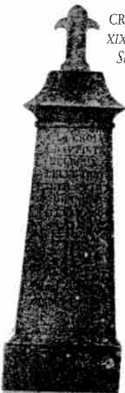
CROIX À BAPTISTE